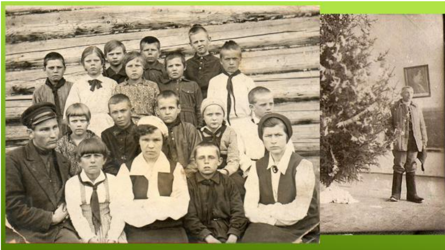
Первые учителя школы. Первые ученики – 1924 – 1926гг