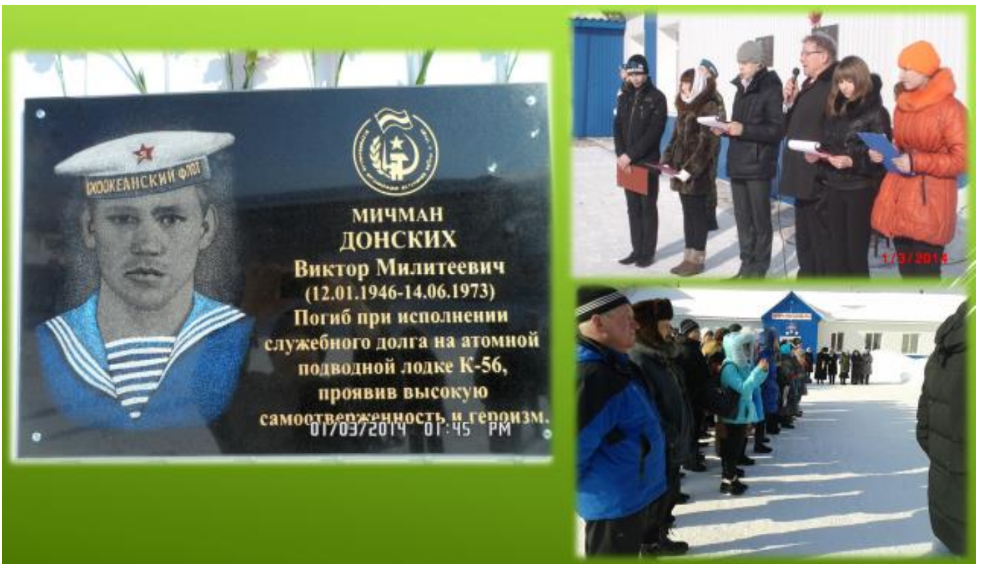
Открытие мемориальной доски в память о выпускнике школы, погибшем 14 июля 1973 на атомной подводной лодке К-56